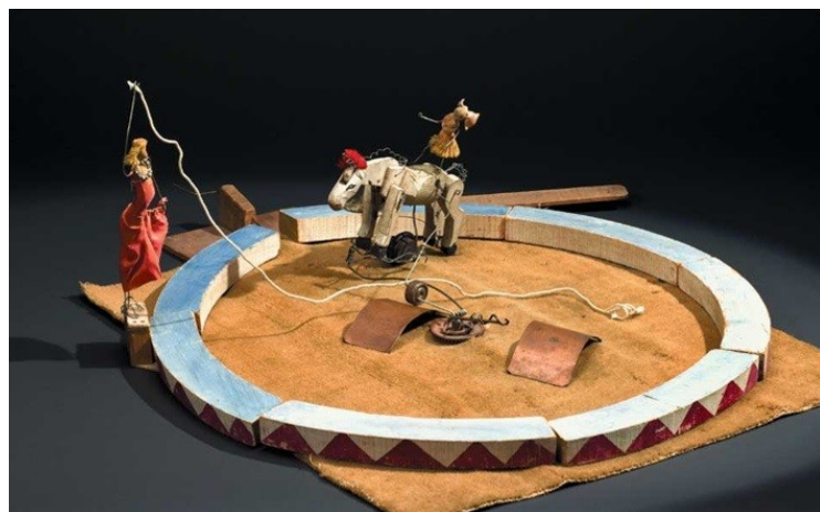
Le cirque - Alexandre Calder - L'écuycère

Sculpteur et peintre américain (1898 - 1976) célèbre connu pour ses mobiles, assemblages de formes animées par les mouvements de l'air et ses stables. Calder a notamment imaginé des jouets : animaux en fil de fer ou mécaniques prélude à la création du cirque.