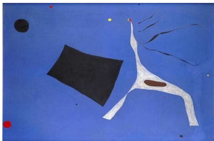
Joan Miró - Le cheval de cirque - 1927

Son œuvre reflète son attrait pour le subconscient, pour l'« esprit enfantin » et pour son pays. À ses débuts, il montre de fortes influences fauvistes, cubistes et expressionnistes, avant d'évoluer dans de la peinture plane avec un certain côté naïf.