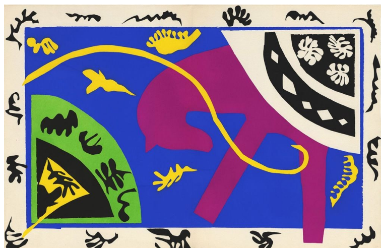
Henri Matisse - Le cheval - série Jazz - 1947